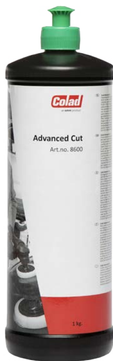
Арт. 8600 Объем: 1 кг

Абразивная полировальная паста, предназначенная для быстрой и агрессивной полировки поверхности. Не содержит растворителей, а следовательно удобна в использовании и безопасна для деталей из резины и пластика.