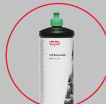
арт. 8600 (1 кг)