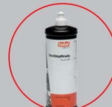
арт. 8700 (1 кг)